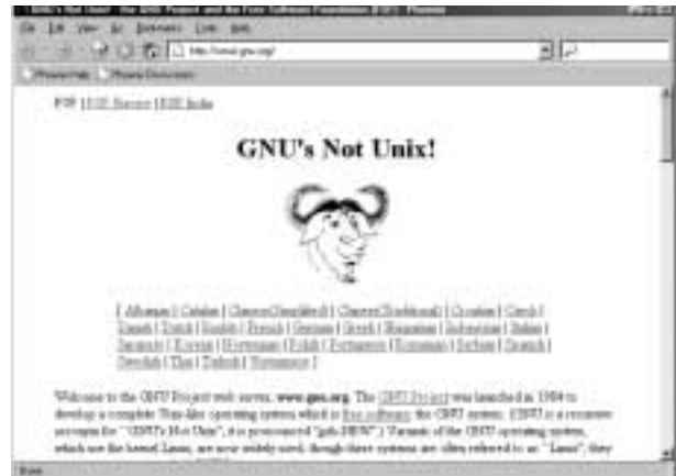
Fig. 1: Página del Manifiesto GNU. Captura de pantalla de la página vista con el navegador Phoenix, Software libre en pleno desarrollo.

El anuncio de la liberación del Netscape Communicator, en 1998, fue el punto de partida del lanzamiento de muchas compañías bien estable-