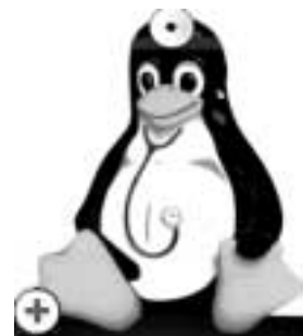
Fig. 2: Logotipo del Sistema Operativo Linux, probablemente la mascota más popular en Internet, que suele caracterizarse con múltiples formatos.

No todos saben que, por lo regular, las empresas no venden programas informáticos, sino que