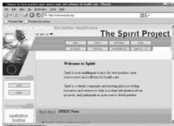
Fig. 3: El proyecto Spirit, financiado por el V Programa Marco de la Unión Europea: Open Source para Sanidad.

— Estado Francés: En el Decreto n.º 2001-737 de 22 agosto 2001 «portant création de l'Agence pour les technologies de l'information et de la communication dans l'administration» sobre creación de la agencia para las tecnologías de la información y comunicación en la administración, de Francia (ATICA), bajo la autoridad del Primer Ministro, se formula: «Se anima a las administraciones que utilicen software libre y estándares abiertos» («Elle encourage les administrations à utiliser des logiciels libres et des standards ouverts»). Esta Agencia también está oficialmente a cargo de promover el open source/software libre y seleccionar la licencia del copyright, basada en las existentes de «software