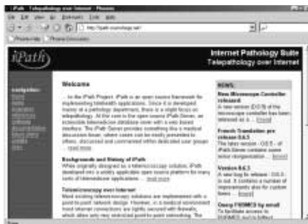
Fig. 6: Telemicroscopía en Internet: el Proyecto iPath en la Web.

en un futuro cada vez mas próximo. Hay muchos expertos informáticos, por lo general muy jóvenes, que son conscientes de ello y están librando una dura batalla. Saben que tienen en sus manos una antorcha de libertad. Conocen su significado, el futuro que anuncia, y saben que pueden cambiar el mundo. Esta es la luz brillante que ha encendido el Software Libre. Es difícil encontrar precedentes, en tiempos modernos, para este fenómeno: una entrega permanente de la propiedad intelectual a la humanidad. Se trata de una decidida apuesta por la Libertad. Tenemos en nuestras manos una oportunidad única: cooperar con nuestros talentos en el desarrollo positivo de estas nuevas tecnologías, de esta nueva cultura, y protegerla de gobernantes irresponsables, de comerciantes sin escrúpulos, de traficantes que convertirían las telecomunicaciones en nuevas barreras sociales. Hay muchas personas esforzadas, inteligentes, apasionadas y casi siempre muy jóvenes, pero sumamente expertos en informática y comunicaciones, que trabajan duramente en este campo. Ante esto... no podemos quedar indiferentes. (11).